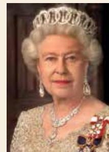
Кралица Елизабет II

Първоначално Cohiba била протоколна пура в три размера — „Lancero“, „Corona Especial“ и „Panetela“ и е предназначена за Кастро и други висши функционери, както и за дипломатически подаръци. Получавали са ги кралица Елизабет II, Леонид Брежнев, Саддам Хюсеин, ис-