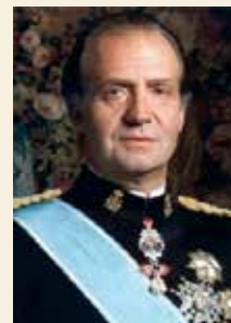
Крал Хуан Карлос

панският крал Хуан Карлос и други държавни глави. Марката бързо придобива изключителна репутация на първокласен продукт и става известна на ценители на пури по цял свят, но едва от 1982 г. започва да се произвежда за по-широка консумация.